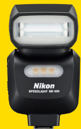
BLITZGERÄT SB-500 (FSA04201)