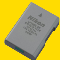
AKKU EN-EL14A (VFB11408)